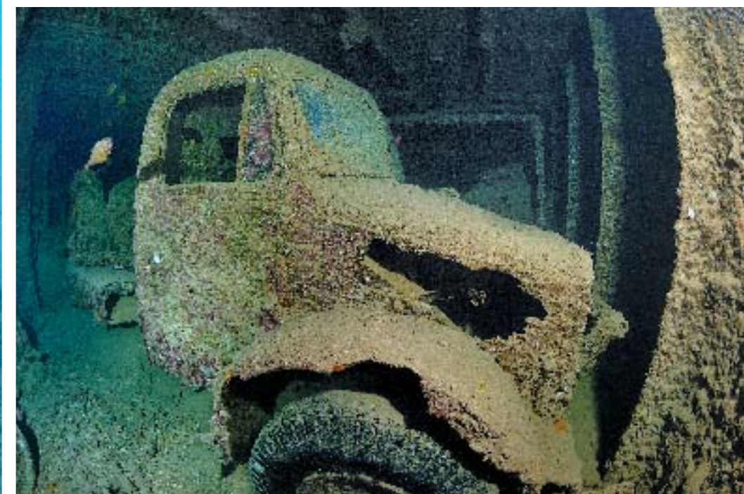
Vrachtwagens Aan boord zijn Bedfords en een Tilling Stevens te vinden.

Dit wrak is een echte tijdscapsule bedenk ik me als we langs de lijn naar beneden storten. Overigens is het ook een oorlogsgraf: vier bemanningsleden en vijf schutters van de Britse marine vonden de dood in de nacht