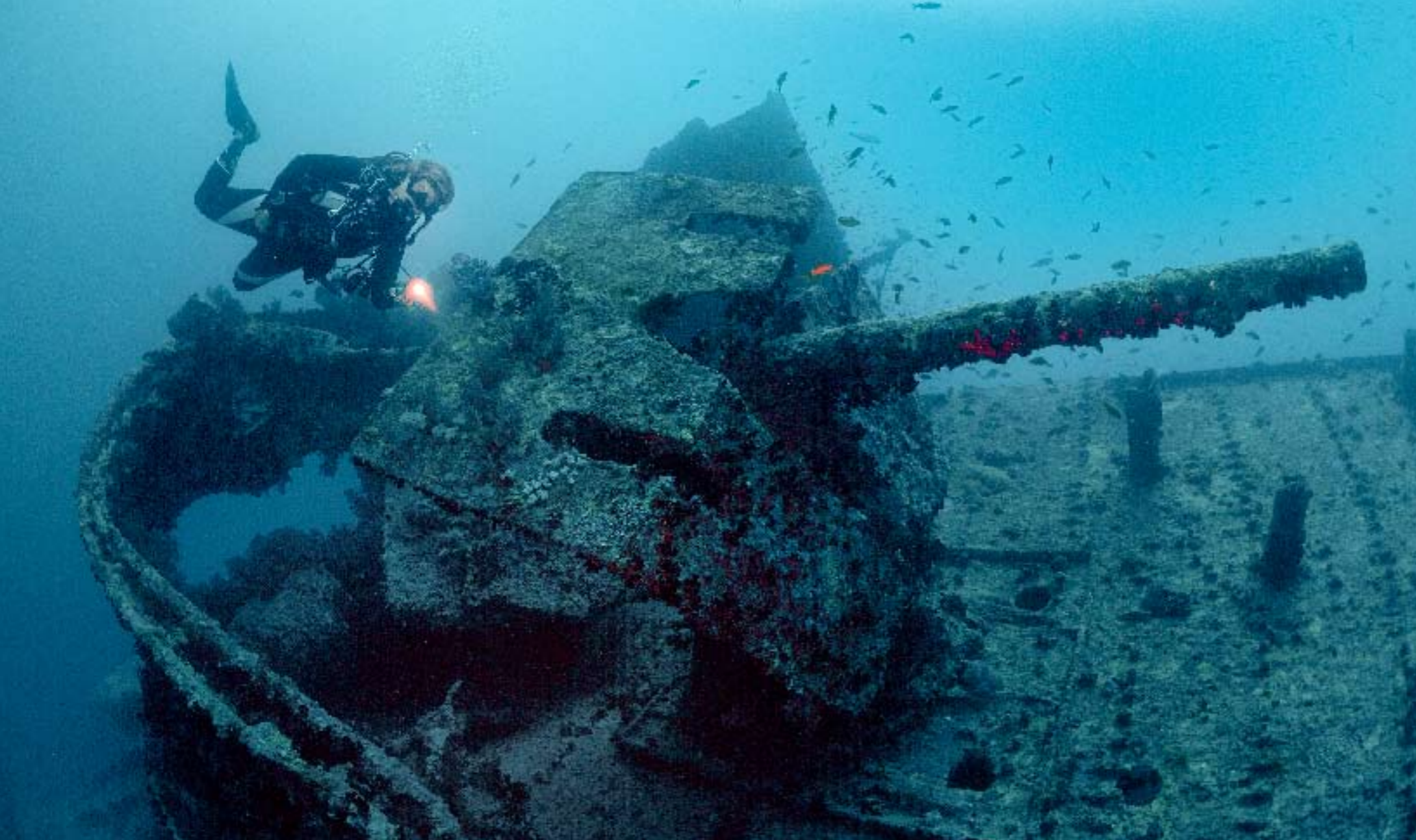
Indrukwekkend - Op het achterdek staat het luchtafweergeschut.

H et is de perfecte dag. Het water is rimpelloos wanneer we de Travco Marina in Sharm el Sheikh in alle vroegte verlaten. Na een paar uur stevig doorstomen - de zon is intussen opgekomen - zien we in de verte twee witte stipjes. Een klein wonder: twee boten liggen maar voor anker boven de Thistlegorm. We hebben het wrak bijna voor ons alleen.