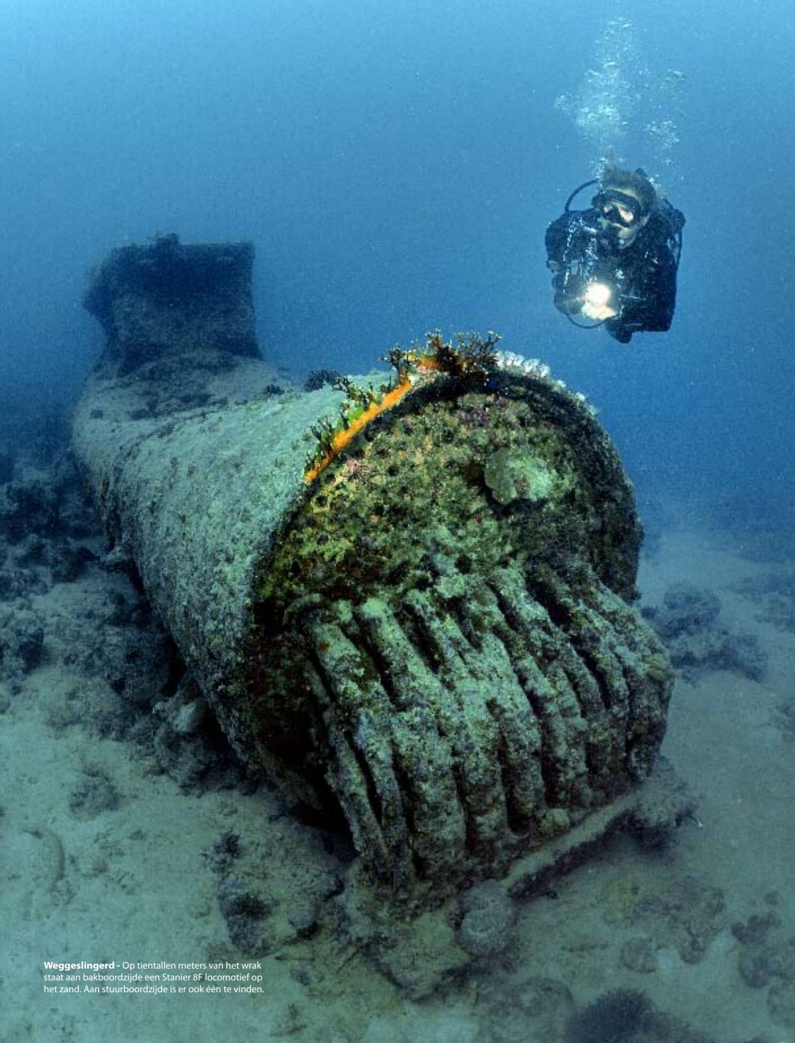
Weggeslingerd - Op tientallen meters van het wrak staat aan bakboordzijde een Stanier 8F locomotief op het zand. Aan stuurboordzijde is er ook één te vinden.

voor het eerst de Thistlegorm terug. De beelden uit de film The Silent World zijn nog steeds op internet terug te vinden. In de film zie je een duiker in zwembroek, met op zijn rug drie kleine duikcilinders. Op dertig meter diepte op de zeebodem vindt hij een dikke ankerketting. Als een dolle zwemt hij langs de ketting tot hij bij de boeg van het wrak komt. Aan dek vindt de duiker een begroeide scheepsbel. Het mes komt te voorschijn en hij begint te hakken: grote brokken koraal vallen naar beneden. Zo komt de naam van het wrak te voorschijn: Thistlegorm.