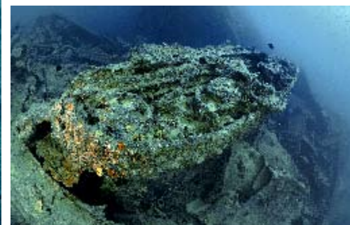
Ruim 4 Op de plek waar de Duitse bommen insloegen ligt een Bren Carrier MK II-tank.