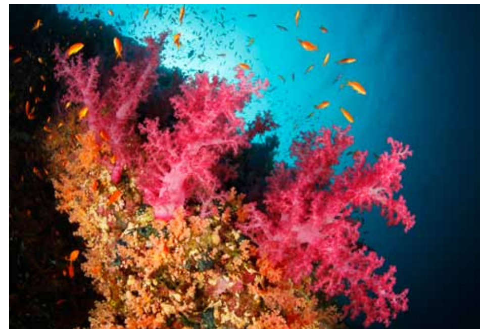
Felroze zachte koralen en oranje vlaggenbaarsjes domineren het onderwaterschap.

Het is half vijf in de ochtend, erg vroeg voor een vakantie. Maar we vertrekken naar de Thistlegorm, een wrak dat je moet zien wanneer je in Sharm el Sheikh bent. De tocht naar de Thistlegorm duurt enkele uren, en dat geeft ons de gelegenheid te genieten van de zonsopkomst boven de Sinäi. Langzaam verkleuren de bergen van roodbruin naar bruingeel. Een prachtig kleurenspeel van de natuur. Hier en daar zien we nog kampen met Bedoeïenen, de oorspronkelijke bewoners van de Sinäi. In hun tuinen staan dromedarissen en paarden, de typische vervoersmiddelen van de Bedoeïenen. Onder het genot van een ontbijt worden we gebriefd over