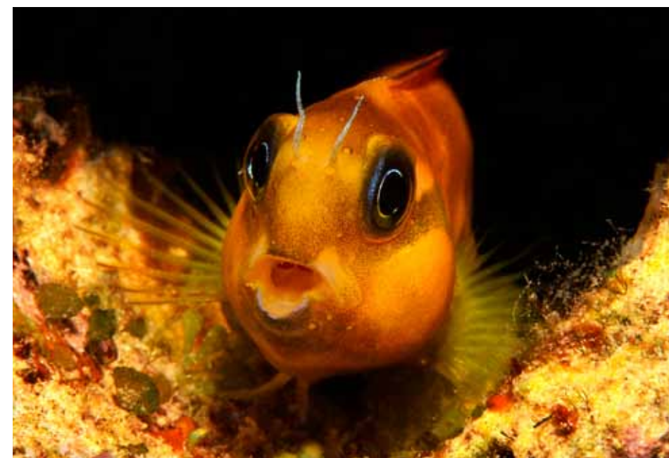
De Midas blenny ( Ecsenius midas ) gaat graag op in groepen vlaggenbaarsjes die hij dan ook nabootst.

DE SCHILDPAD GAAT ONGESTOORD DOOR. HET IS ONGELOOFLIJK WAT EEN KRACHT HIJ MET ZIJN BEK UITOEFENT. IK ZOU HIER NIET GRAAG MIJN VINGER INSTEKEN