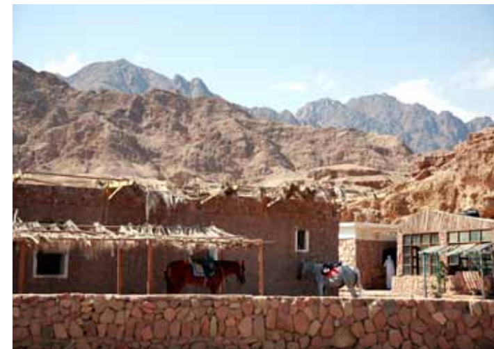
Bedoeïenenkamp met op de achtergrond de roodbruine bergen van de Sinäi.