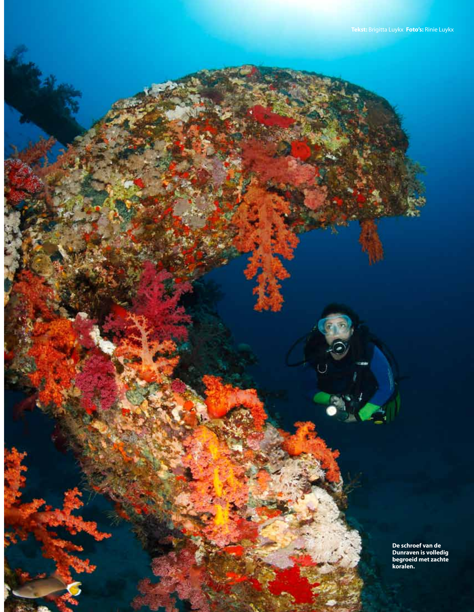
De schroef van de Dunraven is volledig begroeid met zachte koralen.

Een grote gele gorgoon trekt mijn aandacht. De spitsnuit koraalklimmer die ervoor zwemt, blijft op 50 centimeter afstand van mij stilhangen. Plots krijgt hij mij in het vizier en vlucht snel terug naar de gorgoon. Ik kijk waar hij gebleven is, maar hij houdt zich goed schuil tussen de lagen van de gorgoon. Af en toe komt hij tevoorschijn, maar zodra hij mij ziet, verdwijnt hij weer. Rinie gebaart me om bij een van de grote